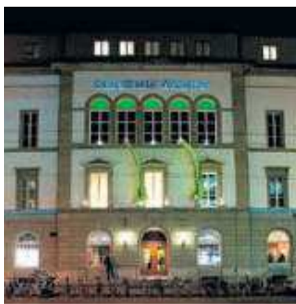
Das Casinotheater Winterthur.

ren zum Beispiel, dass eine Vorstellung ein paar Tage später besucht werden kann», so Bürge. Es kommt aber auch vor, dass Leute versuchen, Ticketreservierungen mit teils kuriosen Ausreden rückgängig zu machen.